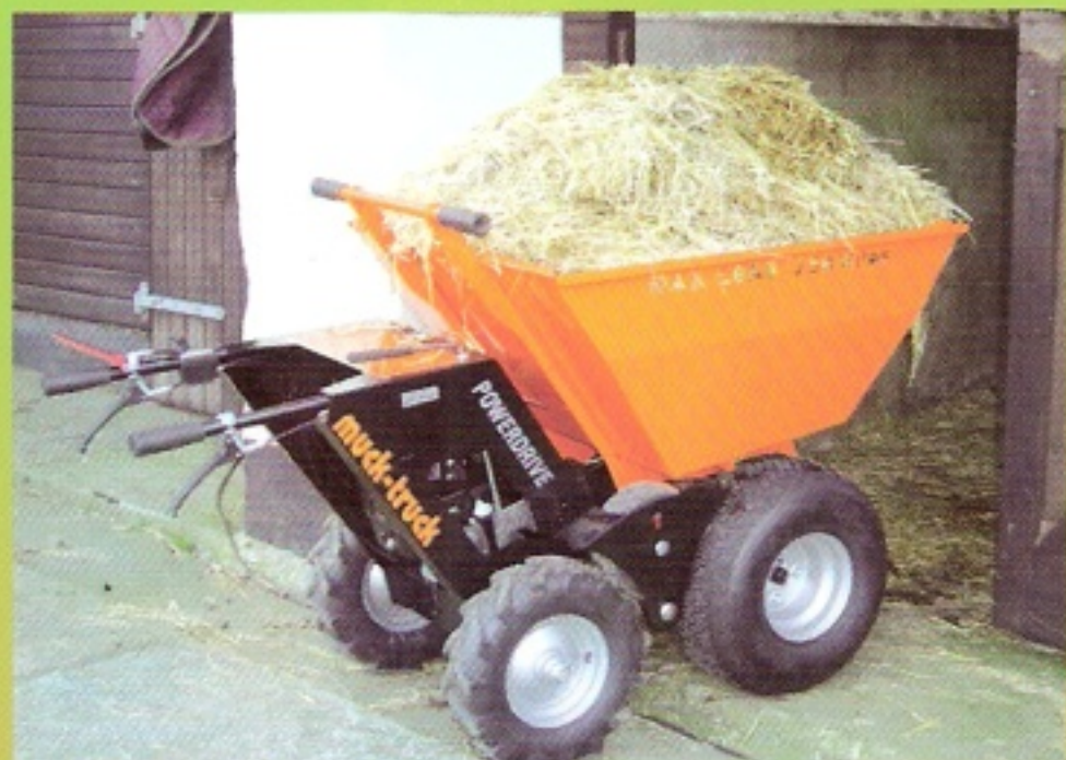
Větší korba - 220l