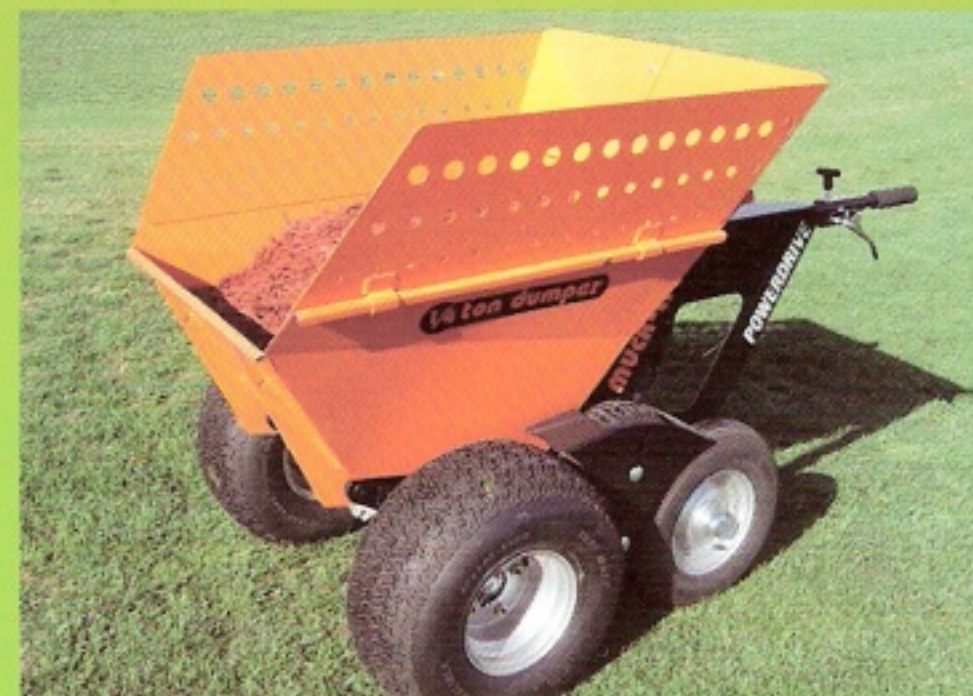
Nástavce na korbu