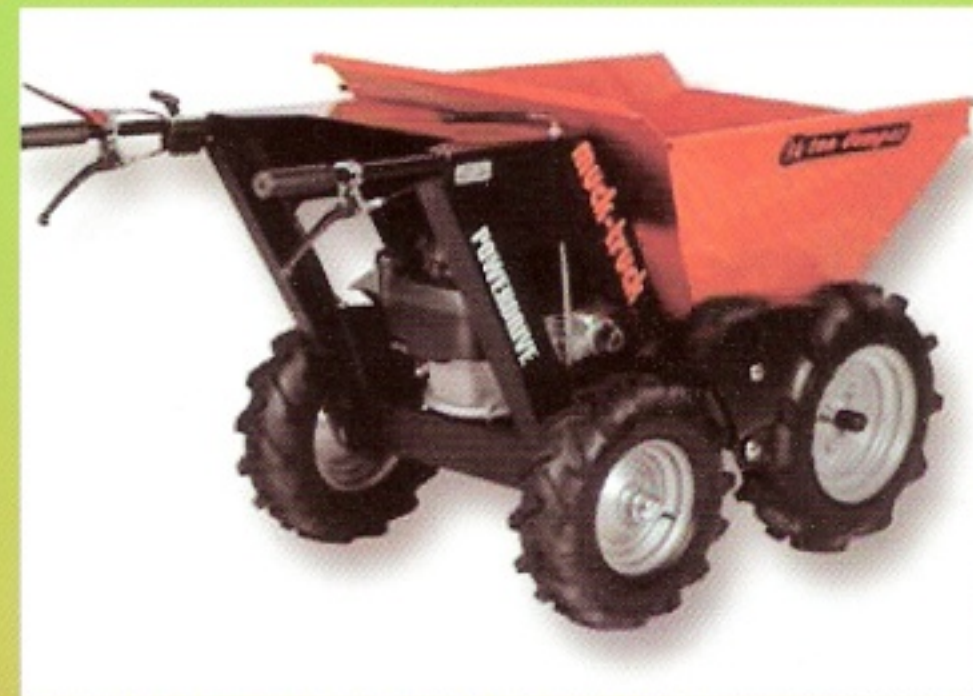
muck-truck s korbou 170 l